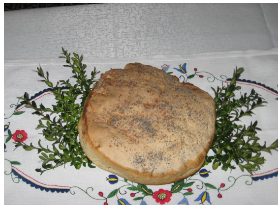
Chleb babci Stasi